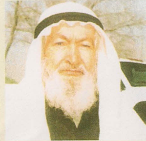
.. أيام شبابه

وتم اختيار العم عاشور للتفاوض مع أحد مسؤولي الشركة على مطالبهم مثل زيادة الرواتب وتوصيل