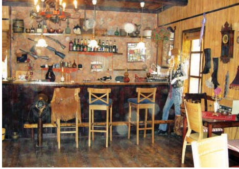
• مقهى رعاة البقر