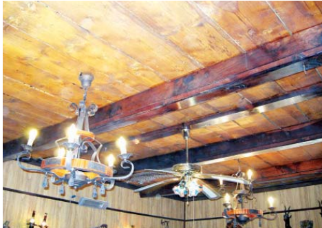
• السقف الحقيقي