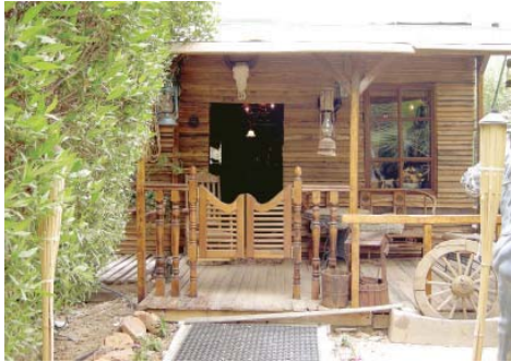
• بوابة منزل الرعاة