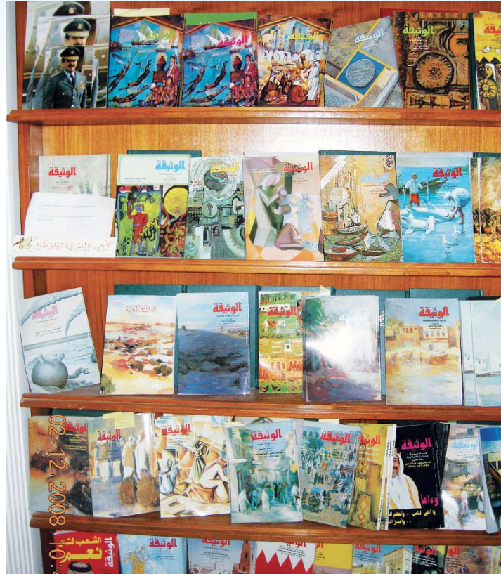
• أعداد من مجلة «الوثيقة»