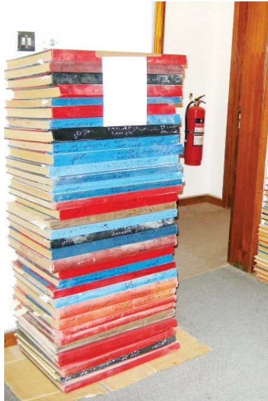
• أعداد من جريدة أخبار الخليج