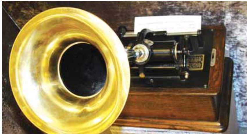
• بشخنة نادرة

قبالة شبه الجزيرة الهندية والعلاقات التجارية معها. أما مجموعة رائد العشي فكانت مجموعة نادرة من العملات العربية التي يعود بعضها إلى القرن الثاني الهجري وبعضها إلى العصر المملوكي، وكذلك مجموعة من العملات والأختام السلطانية من بلاد الرافدين وأخرى من الأختام