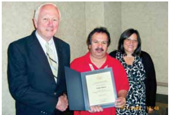
• الرئيس يتسلم شهادة تقدير من تشارلز غرامام

استضاف برنامج القيادة للزوار الدوليين التابع لدائرة الشؤون التعليمية والثقافية (اي سي ايه) التابعة لوزارة الخارجية الاميركية بترشيح من «القيس» الرميل فاضل الرئيس ومجموعة من رسامي الكاريكاتير في الشرق الاوسط لتعزيز دائرة التفاهم المتبادل بين الولايات المتحدة والبلدان الأخرى من خلال التبادل التعليمي والمهني والثقافي.