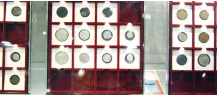
• عملات من أوائل القرن الماضي