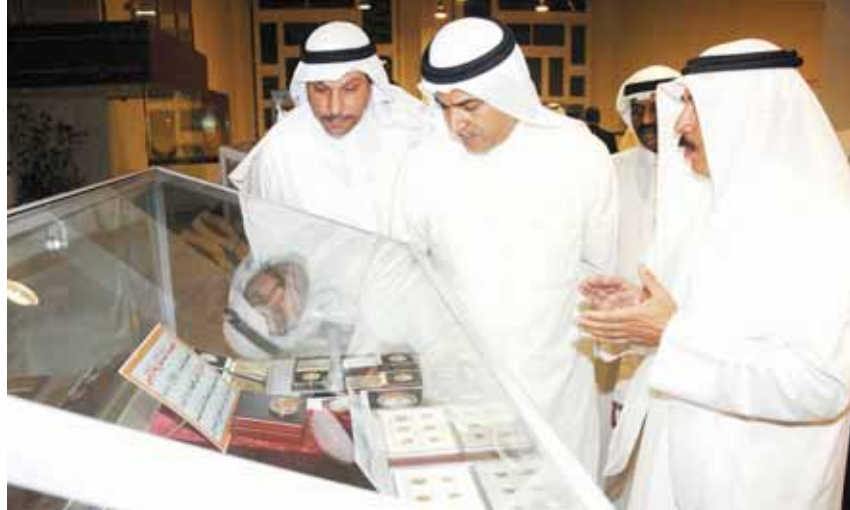
• البوابة يتابع العروض

معروضات الرفاعي تمثلت في مجموعة نادرة من الرسائل الشخصية والمكاتبات الخاصة وتكشف الحساب التي تجرز طبيعة المعاملات