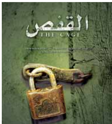
• من الافلام التي كانت مرشحة للمهرجان