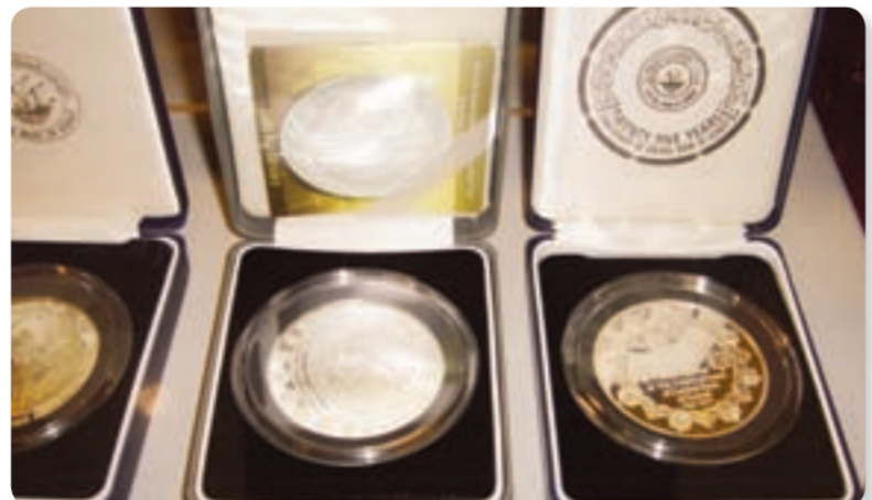
• عملات من جميع دول العالم