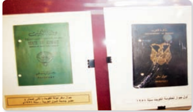
• جوازات سنة 1936-1958