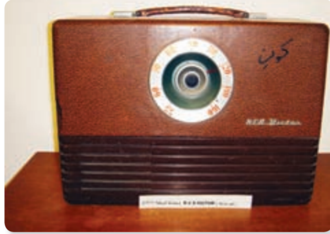
• راديو صناعة امريكية سنة 1947

وجميل وجيلاً وهذا اعتبره شيئاً نادراً لذلك اتمنى المزيد من هذه المعارض حتى يتعرف هذا الجيل على الأشياء الجميلة الباقية من الماضي.