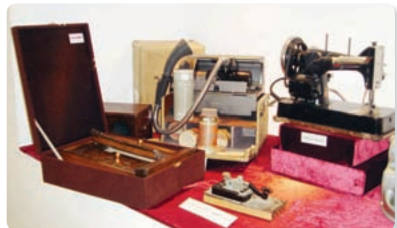
• مجموعة السلع القديمة