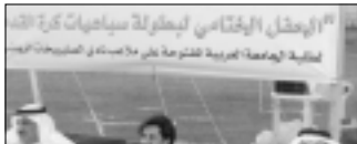
الحربي والممدود خلال فتم البيئية

واضاف لشد نحن نقدم بهذه الكفاة تشاكرين للجميع وقوفهم ومؤازرتهم